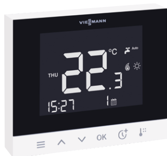
Nuovo Vitotrol 100-E